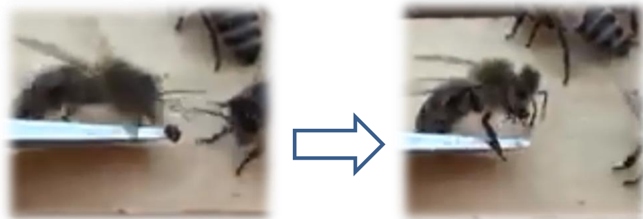
Istinto di autopulizia della varroa