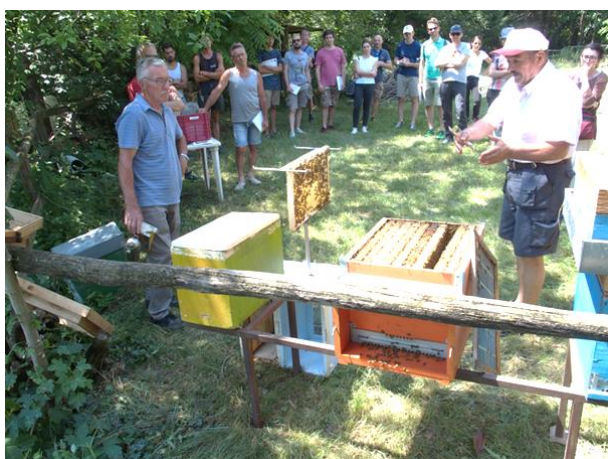
Formazione pratica di nuovi nuclei